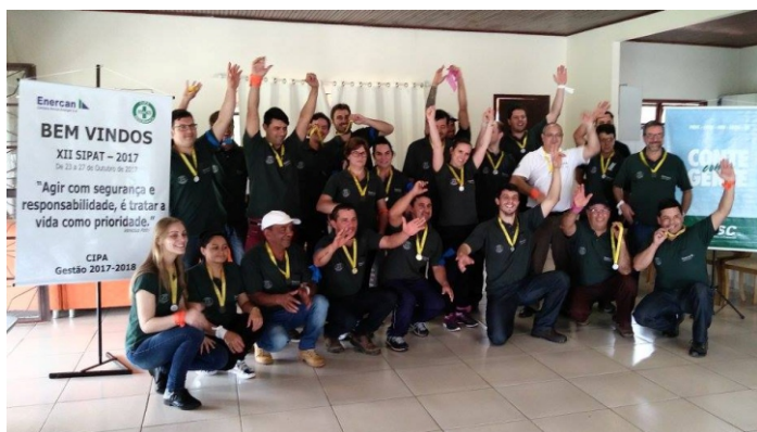
Equipe vencedora da Gincana da Segurança, uma das boas atrações da programação da XII SIPAT

De 23 a 27 de outubro, colaboradores da Usina Hidrelétrica Campos Novos participaram da XII SIPAT (Semana Interna de Prevenção de Acidentes de Trabalho), evento realizado anualmente com o objetivo de fortalecer a importância da saúde e da segurança no trabalho. Foram cinco dias com diversas atrações, com destaque para