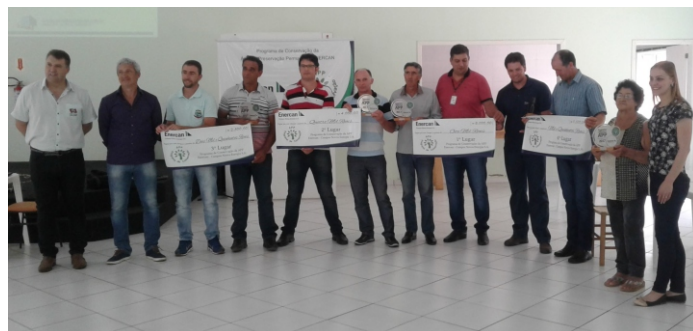
Vencedores do Programa de Conservação da APP exibem os cheques recebidos

Criado com o objetivo de reconhecer e valorizar moradores lindeiros que adotam boas práticas de proteção ao meio ambiente, o Programa de Conservação da APP quer fortalecer a conscientização ambiental e premiar agricultores que efetivamente ajudam a proteger a mata ciliar e, assim, contribuem para manutenção da biodiversidade. Em sua sexta edição, o programa registrou 139 inscrições, número 12% maior do que em 2016, quando 124 agricultores participaram, o que comprova a boa aceitação da ideia de preservar a natureza.