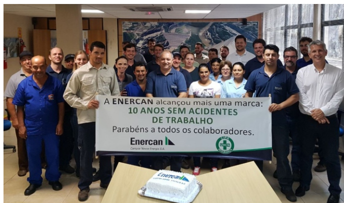
Colaboradores da ENERCAN comemoram a conquista dos 10 anos sem acidentes de trabalho com afastamento

A conquista obtida também pode ser creditada à atuação da CIPA (Comissão Interna de Prevenção de Acidentes). Com ações relevantes promovidas anualmente, como a SIPAT (Semana Interna de Prevenção de Acidentes do Trabalho), os colaboradores são alertados com frequência para a necessidade de valorizar a saúde e a segurança no ambiente de trabalho.